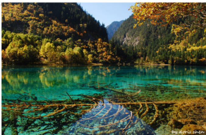
桃乐丝 五花海，美得令人震撼

轻帆 老虎嘴，这里是俯视五花海全景的最佳地点，从车窗看下去整个海子就像孔雀的形状美丽极了。