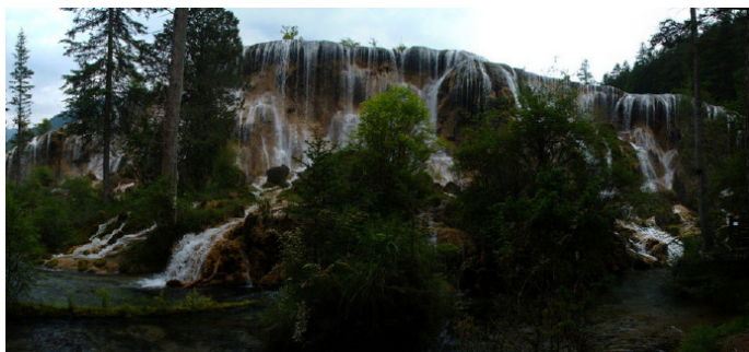
老汤姆 珍珠滩瀑布全景

传说很久以前，一位过路的女神爱上了一位藏族青年，小伙子送她一串珍珠项链，女神回赠她一把开山斧。青年用开山斧开水渠引水，被天神知道后，勃然大怒，派兵来捉拿女神，一把扯断了她脖子上的项链，珍珠纷纷落地，化作美丽的珍珠滩。