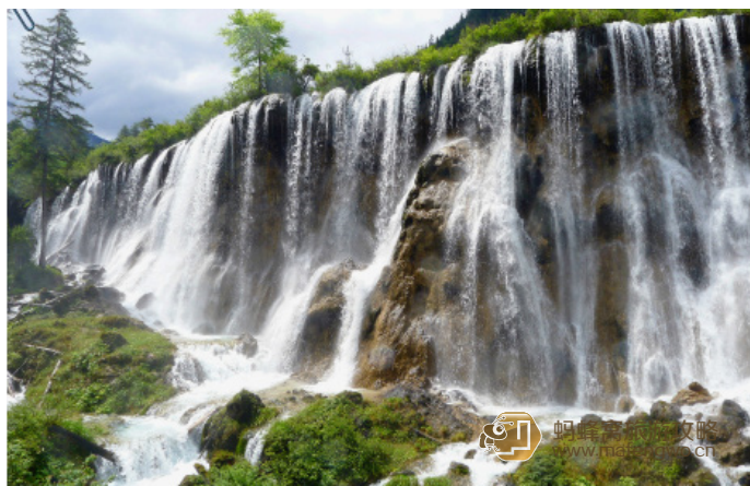
梓辛 远处的诺日朗瀑布，这里还是西游记的外景地呢

诺日朗三个字为藏语的译音翻译过来是男神的意思，象征高大雄伟。瀑布落差 20 米，宽达 300 米，顶部平整如台。瀑布对面建有一座观景台，站在台上，瀑布全景尽收眼底：早晨，阳光照耀下，常有一道道彩虹横挂山谷，使得飞瀑更显丰姿迷人；垂帘般的水流落下，激起水花万朵，如断续的珠子，四处抛洒。冬季，瀑布常形成巨大的冰幔，无数的冰柱悬挂在陡崖之上，成为一个罕见的冰晶世界。诺日朗瀑布是迄今为止在中国发现的最宽的钙华瀑布，也是 1986 年版电视剧《西游记》的片尾拍摄地。