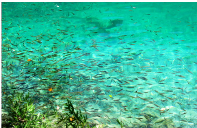
冰淇淋 85111 熊猫海的冷水鱼，据说是没有鱼鳞的

前行不久，发现栈道开始变陡，再加上海拔高所以这段路走得非常辛苦。但一定要坚持走下去，辛苦是能得到回报的——这里是九寨沟的最佳观景地点。