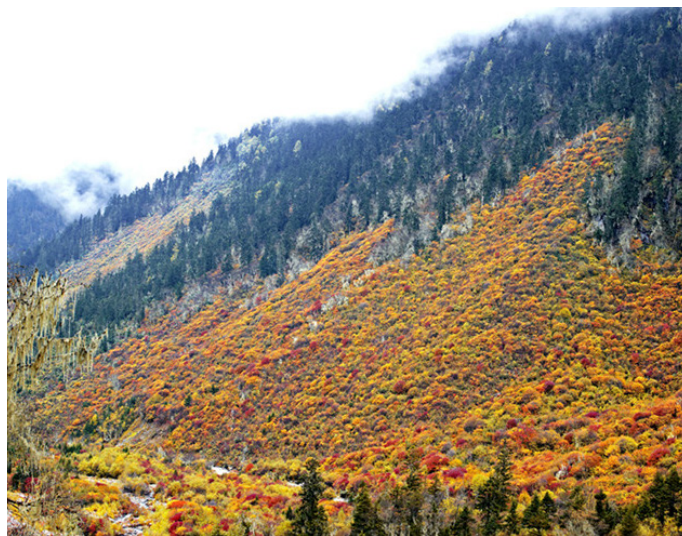
RONGSHI111 米亚罗的金秋，漫山遍野的红叶，迷了我的双眼，醉了我的心

“米亚罗”是藏语，意即“好耍的坝子”，风景区位于成都至九寨沟——黄龙旅游线的中间，地处岷江支流杂谷脑河谷地带，区内群山连绵，江河纵横，林海浩瀚。其中尤以瑰丽的金秋红叶而闻名。每到秋季（9、10月）景区内沿河谷两岸枫树、槭树、桦树、鹅掌松、落叶松等渐次经霜，树叶被染成为绮丽的鲜红色和金黄色。这时候，万山红遍，层林尽染，三千里红叶装饰着三千里江山，成为一大奇观。景区内的主要景点除了红叶区外，毕棚沟、桃坪羌寨、古尔沟温泉、姜维城、萝卜寨、黑虎羌寨也是各具特色的地方。