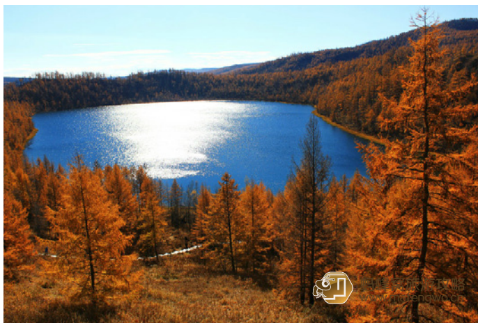
Mark 瑰丽纯澈的驼峰岭天池

驼峰岭天池（见03页），距离游客中心40km，一般游客去的比较少，但是景色非常美。在湖边可以看到浮石（石头放在水里不沉的即是浮石），有兴趣的人可以选一选试试手气。