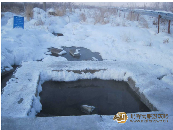
常思一二 阿尔山温泉

严冬的北国，千里冰封，万里雪飘，而阿尔山温泉（见05页）却热气缭绕，泉水淙淙。在寒冷暴热的内蒙古高原能有这么一块优美的地方，实属难得。步入矿泉区，在长500米、宽40米的草地上，密密匝匝排列着48个泉眼，晶莹澄澈的泉水汩汩而出，久旱不涸。每年来阿尔山矿泉疗养院洗浴治疗的人络绎不绝。到了端午节，更是熙熙攘攘，摩肩接踵。