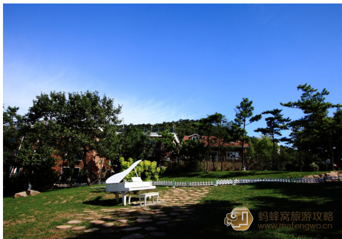
逍遥游 白色钢琴——摄于滨海路燕窝岭婚庆公园