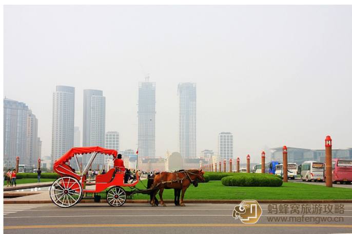
寻路 南瓜型的大马车非常好看

旅游环路车每经过一次大连火车站，会重新计费，需再次购票。因此乘车时请留意行车方向和沿途站点。