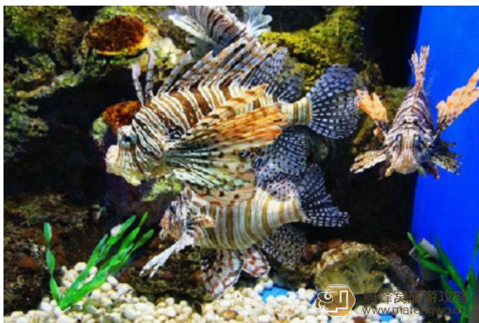
寻路 狮子鱼，这是最好拍了的鱼了，很少游动，估计也是用外表吓人的主儿，大鱼来了，还不得一吃一个准儿。