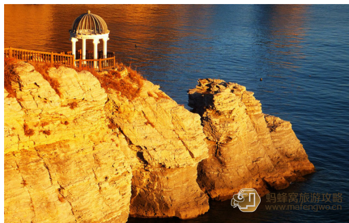
雁荡楠溪 金石滩地质公园

平常心-s 这里游人很少，很幽静，沿着海边的木栈道行走，这边是山，那边是海，行走山海之间，凉爽海风吹来，好不惬意。