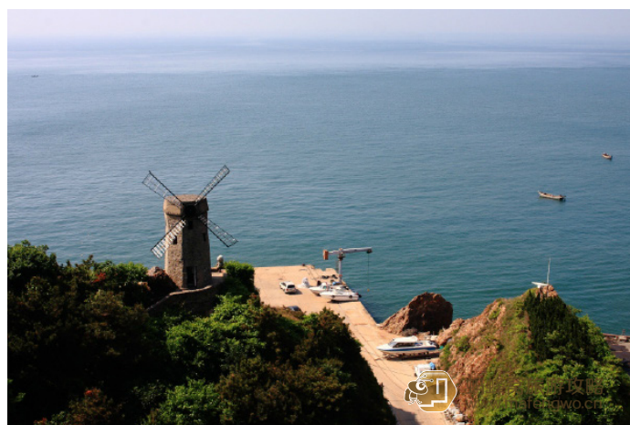
逍遥游 风车——摄于滨海路北大桥

大连滨海路位于大连市南部海滨，是大连风景最好的观光道路。滨海路全长 32km，贯穿沿海岸线的 12 个主要景点。每当春暖花开的季节，穿行在这条公路上，一边是长满针阔叶混交林的山峦和盛开着火红杜鹃的山麓，一边是烟波浩淼的大海和千姿百态的礁石岛屿，沿途美不胜收。如果时间允许完全可以徒步沿滨海路游览，沿途会经过老虎滩、北大桥、燕窝岭、傅家庄、星海广场、星海公园、迎宾路、海之韵公园、棒槌岛、石槽、渔人码头等景点。具体详情可以参考“线路推荐——大连滨海路徒步 2 日游”。大连滨海路的各路段起点分别为：星海广场入口、付家庄入口、老虎滩入口、棒槌岛入口、海之韵广场入口。