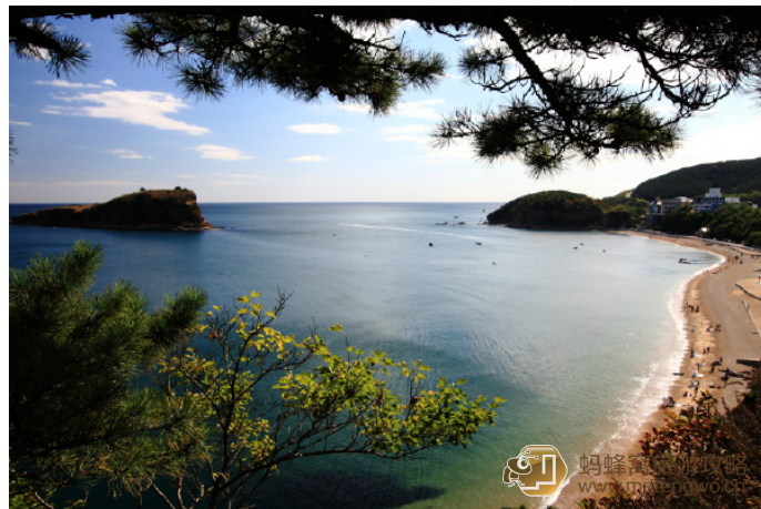
逍遥游 热闹的海滩——摄于付家庄公园

棒棰岛位于大连市滨海路中段, 大连市东南约 5km 处。是一处以山、海、岛、滩为主要景观的风景胜地。因远远望去, 极象农家捣衣服用的一根棒槌, 故称棒槌岛。