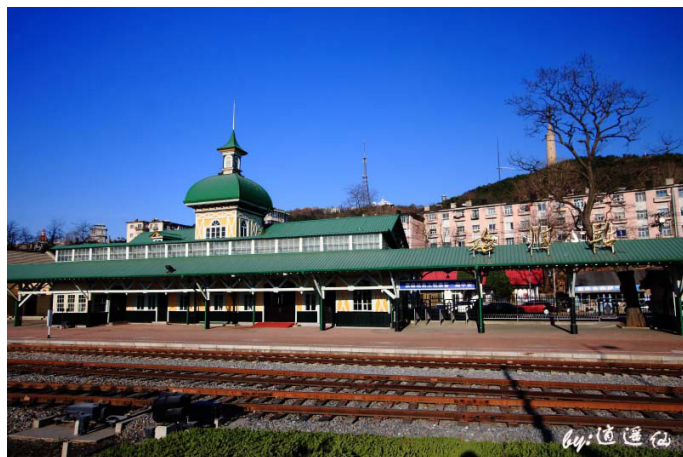
逍遥游 旅顺火车站

逍遥仙 旅顺旅游以观历史为主，主要以日俄和清朝海军史有关，喜欢历史的人可以去看看，景点比较分散，感觉门票都比较贵。