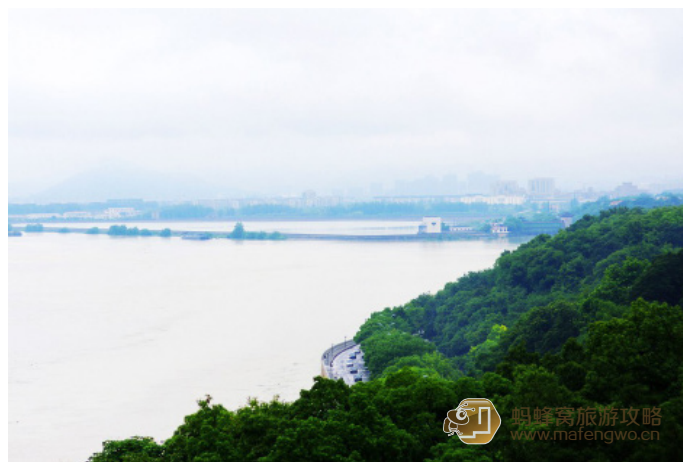
随遇而疯 六和塔远眺

pansyfairy 沿着微陡的石阶和木梯缓缓而行，每到一层就停下来眺望楼外的风景。塔内有雕花繁复的栏杆和年代久远的壁画，彰显着这座塔楼的历史沧桑。登到顶层7楼，远处的钱塘江大桥似乎隐匿在一片烟雾中，对岸林立的高楼也若隐若现。江风拂面，清凉畅快。下塔的路看起来更可怕一些，摸着沁凉的石壁和木制的扶手小心翼翼地走，很快就到底了。有人如是评价杭州的三座塔：六和塔如将军，保俶塔如美人，雷峰塔如老衲。悬铁铃，披红袍，端庄雄伟的六和塔，的确宛如一位气宇轩昂、战功显赫的将军，历尽铅华，正气长存。