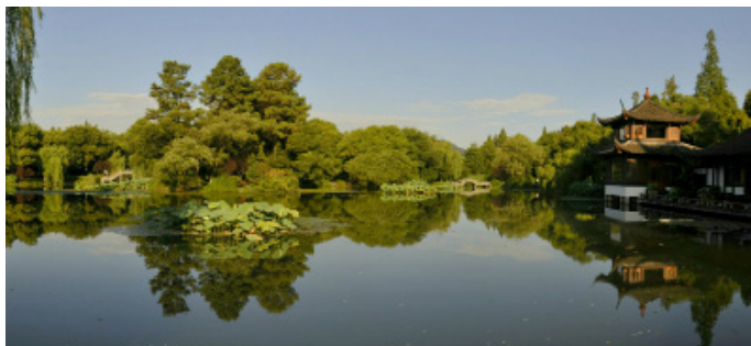
牧马流星 对于西湖十景我倒是独爱曲院风荷

如果走完之后时间还有富裕，可以再去逛下花港观鱼(浴鹄湾出去对面就是)，还能在花港观鱼出来到苏堤坐个摇橹船(大概100块/小时，要自己侃价，可以坐6人)，18:00多看夕阳西下、晚霞满天的时候坐船是一种很享受的过程~~~