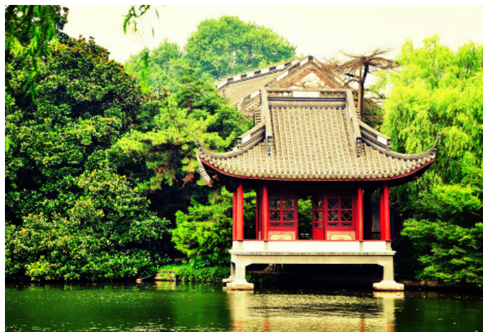
陈诚电影 花港观鱼

Jessie 花港别无新意，这季节(4月中下旬)里属花特别多，我站在大太阳下忘情地拍着各种花，觉得自己都快要变成个大花痴了。然后看孔雀开屏，游人喂鸽子，一个人出来走走，不用顾虑时间不用担忧其它，便十分自在。