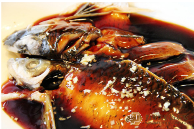
地中海的婚礼 外婆家的西湖醋鱼

地中海的婚礼 听说这家分店是世博会那年开张的，也是所有外婆家连锁店中菜品最好的，多了“外婆系列”“想吃系列”等，装修风格也很有特色，现代感的装饰配上着色鲜艳的陶器，远处墙上用粉笔画了外婆家的故事，非常带感。同时可爱的叫桌声“熬烧，熬烧，阿婆叫你回家吃饭咯”，