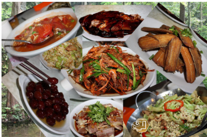
Crystal 油爆虾、干煎带鱼、手撕包菜、干锅花菜、卤鸭、醉红枣、川香牛肉，番茄扁尖汤，太怀念老头儿油爆虾了，每次来杭州必去的饭店

仓基新村：K151、K251(夜间线)、K251(区间)、K76、K516、K348