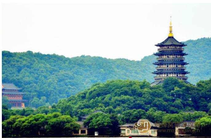
陈诚电影 雷峰塔，即使么有夕照这么看上去也不错

● 一日串联路线：北山路 — 断桥 — 白堤 — 平湖秋月 — 中山公园 — 孤山（楼外楼） — 西泠桥 — 苏堤 — 花港观鱼 — 雷峰夕照 — 南山路 — 湖滨路（崔崔 提供）