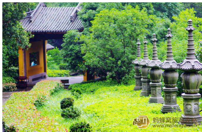
随遇而疯 永福寺,觉得空气都宁静了,这座东晋古刹的安静与灵隐寺的热闹真是天壤之别

永福寺——云栖竹径: http://www.mafengwo.cn/i/882344.html