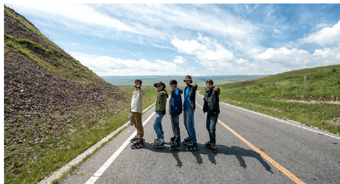
海盗 Ryan 轮滑队伍

跟团游或包车游青海湖都不能实现与青海湖的百分百接触，如果时间充裕的话，最推荐徒步或骑行等方式，深入体会青海湖美景，近距离感受牦牛羚羊的热情好客。有许多年轻人更是以不同的个性方式征服着青海湖，徒步、轮滑、滑板……正如痛苦的信仰乐队在《公路之歌》中唱到的那样“梦想，在什么地方，总是那么令人向往，我不顾一切走在路上，就是为了来到你的身旁”。趁年轻，让我们把疯狂的事做遍，顺着青藏铁路的方向一同去寻找和完成延伸的梦想吧！