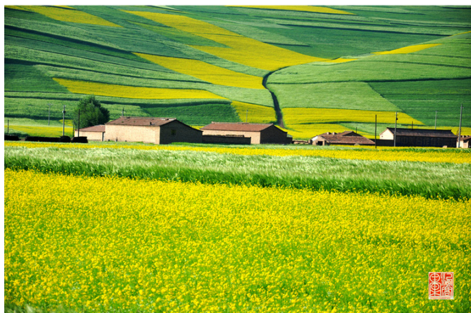
酒窝果果 门源油菜花

阿滋猫 拍照的最佳时间是下午 14:00-16:00，这时的云已经汇聚成团，衬托着天空分外的蓝，光线强而不烈且不是头顶直射。青海的夜黑的晚，8 点半才黑，所以不用担心走夜路回。沿途及门源观景台门口都有卖自己家做的碗装酸奶的，超级好吃，一定要下车去吃，在西宁吃不到那样的。