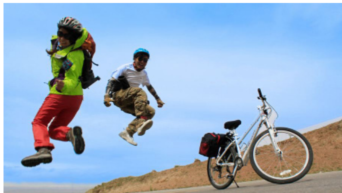
瞎鼓捣 青海湖骑行