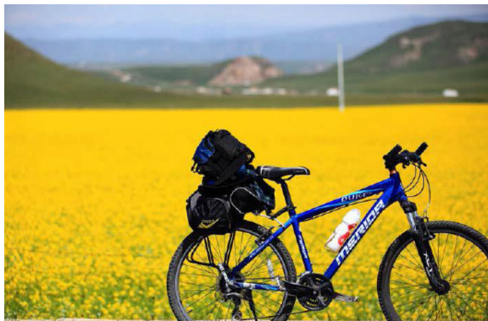
哎哟炜 陪伴我四天的宝马

环湖公路由四部分组成，全长约 360km，路况非常好，每年 7、8 月份举行的环青海湖国际公路自行车赛（Tour of Qinghai Lake）是中国最高等级的公路自行车赛事，比赛路线已经从环湖地区延伸到黄南州的同仁县、海东地区的互助县、循化县和祁连山区的门源县、祁连县，比赛距离 1300km 左右，最高海拔将近 3900m。