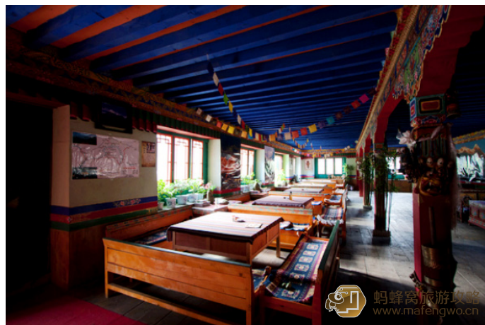
星空 巴青农庄大厅

2 层有个 14 人的大间，50 元一个床位，南边的床位可以躺在床上看南峰。此外 2 层还有几间比较好的观景房，最贵的要 300 元。