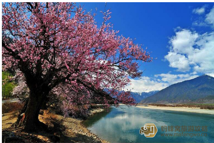
心在旅途 尼洋河春色

尼洋河是雅鲁藏布江的一条支流，传说是神山流出的悲伤的眼泪。尼洋河两岸森林植被完好，河水清、含沙少，是工布江达的母亲河。在拉萨通往林芝的路上，翻过拉萨河与尼洋河的分水岭——海拔5013m的米拉山口，继续往东，就进入了尼洋河河谷。尼洋河在源头是一条细流，到了中游以下，河面越来越宽，水流也渐渐平缓下来，在林芝县附近汇入雅鲁藏布江。尼洋河之美在于水色，清澈、翠绿，飞溅起洁白的浪花。尼洋河有一处叫做中流砥柱的岩石景观，像一枚带纽的四方印章，约一幢别墅大小，矗立在尼洋河激流中心，河水冲击到这块巨石上，溅起一片浪花，翻滚激荡，夺路而去。