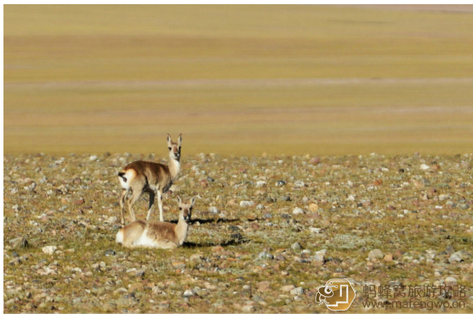
小山 藏原羊，俗称“白屁股”