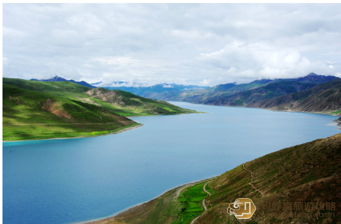
回归信仰 羊湖的美，不在一朝一夕，何时都是如此醉人

索然有味 第一次见到你，我感动到落泪，我无法想像世界上有这样的风景，蓝得那么极致。如果没有旅行，我依旧生活在现实的那个框框里，不知道外面的世界原来如此精彩。也因为你的这抹动人的蓝色，我开始迷恋旅行，去不断发现生活之外的世界，也让我对每一个未知的地方充满向往。我渴望每一次行走都能像见到你一样，让我连呼吸都不敢太用力。