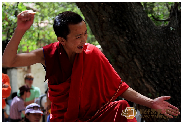
Ladybaby 辩经是藏传佛教学习显宗教义的必经方式。各大寺庙都有，色拉寺的规模尤为壮观。

地址：拉萨市城关区色拉路 1 号（色拉乌孜山） 费用：7:00-17:00：50 元 / 人，17:00 之后 5 元 / 人（寺庙主要大殿经堂关闭、辩经场休停），周日和特殊节日不举行辩经 联系方式：0891-6383639 开放时间：7:00 开放，15:00 开始辩经，17:00 之后主要大殿经堂关闭。 到达交通：乘 6、16、24 路等公交车在色拉寺站下车可达 用时参考：3-4 小时