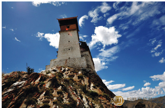
托斯卡纳 雍布拉康给人的第一眼印象往往是高大险峻、气势恢宏。这大概是由于四周都是旷野和农田，加上来路在河谷山脉之间穿行目光所及有限，猛然间见平原上一宫殿拔起于山颠的原因吧。

雍布拉康是西藏历史上第一座宫殿，距今已有2100多年的历史，位于泽当镇东南方向11km处的扎西次日山上，因山势像母鹿的后腿，寺建在鹿腿上而得名：“雍布”是母鹿，“拉”是后腿，“康”是宫殿。寺的规模很小，但耸峙山头，居高临下，十分壮观。站在山上最高处的塔楼凭高远望，雅鲁河谷和田园风光尽收眼底。传说文成公主初来西藏时，每到夏季都会和松赞干布来这里居住。在扎西次日山东北方向约400m处有一名为“噶尔泉”的泉水，四季长流不息，据说此泉水能治百病，到雍布拉康朝拜的老百姓多来此喝水净身。