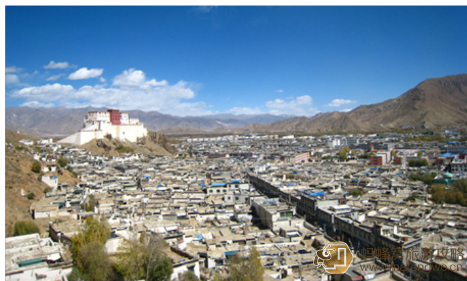
⊕. 啊噢° 扎什伦布寺

扎什伦布寺是西藏日喀则地区最大的寺庙，位于日喀则城西的尼玛山东面山坡上，是班禅的驻锡地，后藏的宗教中心，与拉萨的甘丹寺、色拉寺、哲蚌寺，西宁的塔尔寺，甘肃的拉卜楞寺并列为格鲁派“六大寺”。