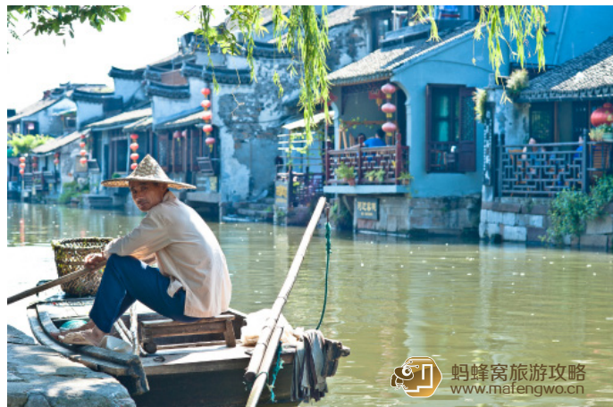
快 yoyo 慢 yoyo 蓝木 西塘悠闲的船夫

车是不能进入西塘镇的, K215 公交车下车后, 如果不想步行, 可以坐人力三轮车, 5 元/人, 西塘景区内除了游船 (娱乐 10 页) 之外, 只能靠步行。当他们告诉你他们从哪哪可以进去, 然后只收你多少钱进入景区, 千万别信, 走到景区门口大概就 10 分钟。