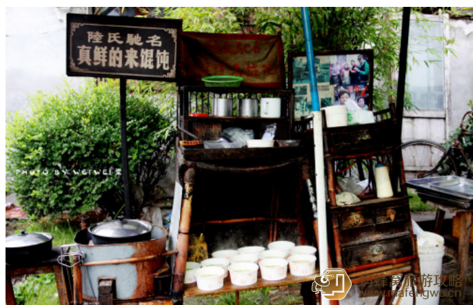
WEIWEI 素 西塘有名的陆氏馄饨

在烟雨长廊的来凤桥和永宁桥之间，有家专做豆腐花的小店，同时也卖绿豆粉条，酸香入味，独具特色。钱氏祖传豆腐花一碗 5 元。如果不特意说明，豆腐花都是咸的。