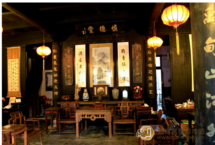
大头鬼正在发育 种福堂的大厅

景区内的明清古宅多位于深巷内院，庭院幽深，一切陈设皆为老古董，虽然不临水，但宅院宽大，可深切体会古镇望族的古韵生活。十分安静，价格也是最便宜的。在百年雕花床上，闻着空气中氤氲的水乡气息，渐渐沉睡。