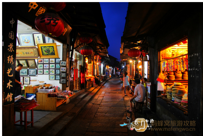
甲板上的海阔天空 西塘西街上形形色色的购物店

到西塘可以买一些黄酒、五香豆、八珍糕、六月红、粽子。特别是黄酒，西塘人历来爱喝点黄酒，因此，在西塘历史上有过许多大大小小的黄酒作坊。如今全国最大的单个黄酒生产企业——嘉善酒厂就坐落在西塘镇的北部。