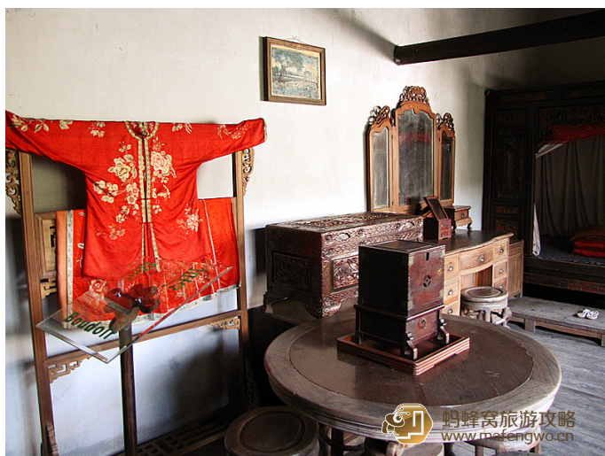
大头鬼正在发育 倪宅，破破旧旧的老宅让人安神益气。