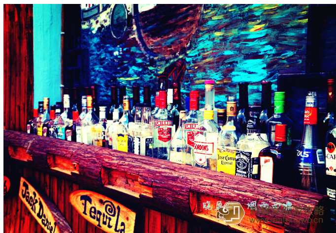
晓姬様 很有特色的酒吧

西塘古镇上游一条有名的酒吧一条街——塘东街。30 多家酒吧聚集在这条街上，口碑不错的江南忆酒吧（18 号，0573-84560290）和红庭酒吧（9 号）就在这条街上。西塘热闹的酒吧有最低消费，人均 50~150 元不等。