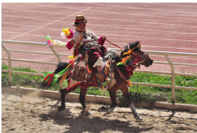
📷 欢腾的香格里拉赛马节

6 月是香格里拉最美的季节之一, 也是旅游旺季, 交通、住宿、餐饮等都会比较紧张。如果想参加赛马节, 最好提前预定住宿。