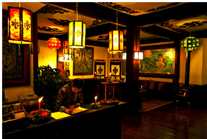
藏马蔷薇 松赞绿谷前台

地址：香格里拉松赞林寺旁 网址： http://www.songtsam.com/ 参考价格：960元/间（大床房）