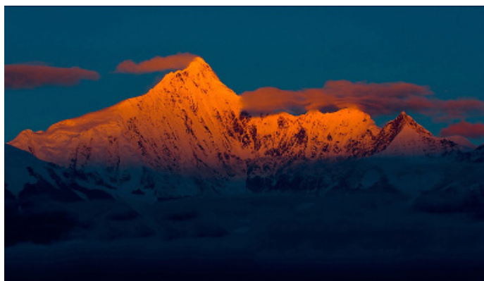
渔夫 梅里雪山日照金山美景

戴草人的稻草帽 飞来寺是瞻仰梅里十三峰的最佳地点。周围有很多观景客栈，可以住在客栈，第二天一早看日照金山。