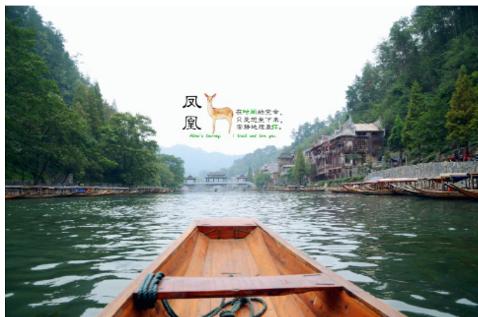
溇生。沱江下游泛舟

不用刻意寻找船家，因在古城内，不时会有船家过来揽人，即使两个人，船家也愿意单走一次。在找船时，最好多问一句“是你划船吗？”，因为也会有帮船家拉客的妇人做中间人，价格稍贵。