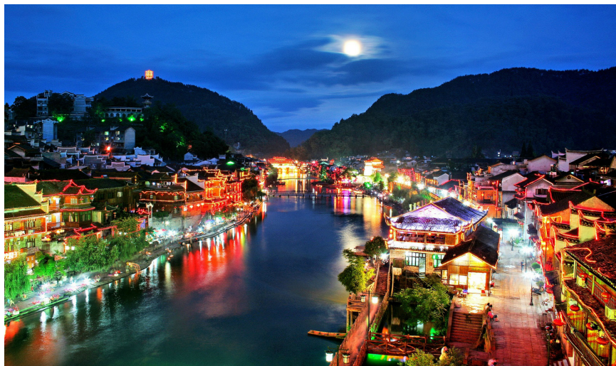
gd 梁山伯 凤凰夜景

Annie 哪里有旅游哪里就必定会有商业。很多人说很失望,因为凤凰越来越商业化,到处都是酒吧一条街,购物一条街。我想若你真的喜欢一个地方,你一定是带着欣赏的角度来包容它的兴衰荣败,若你在清晨,人们在沱江边捶衣洗菜的时候,在雨后,街上人流不匆忙的时候,