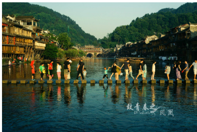
猪儿肥的小窝 跳岩上，总是人来人往

D2：早餐后随车前往苗寨，估计中午可达苗寨。车上的苗族姑娘会教你唱山歌，介绍苗寨的景观和民俗风情。到了苗寨门口，得和苗家人对歌、喝过糯米酒才能进入寨子。在寨子里观赏苗家的歌舞表演，了解当地苗寨民俗文化。下午返回古城，买些特产，次日告别古城。