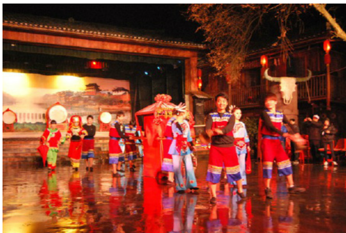
一一丫丫 篝火晚会

这出篝火晚会规模相对较小，但互动性强，演出气氛浓烈。不足的是中间会穿插大量画作拍卖，商业味较浓，忽略这些，还是能看到不少当地民俗如湘西赶尸、哭嫁等精彩表演的。